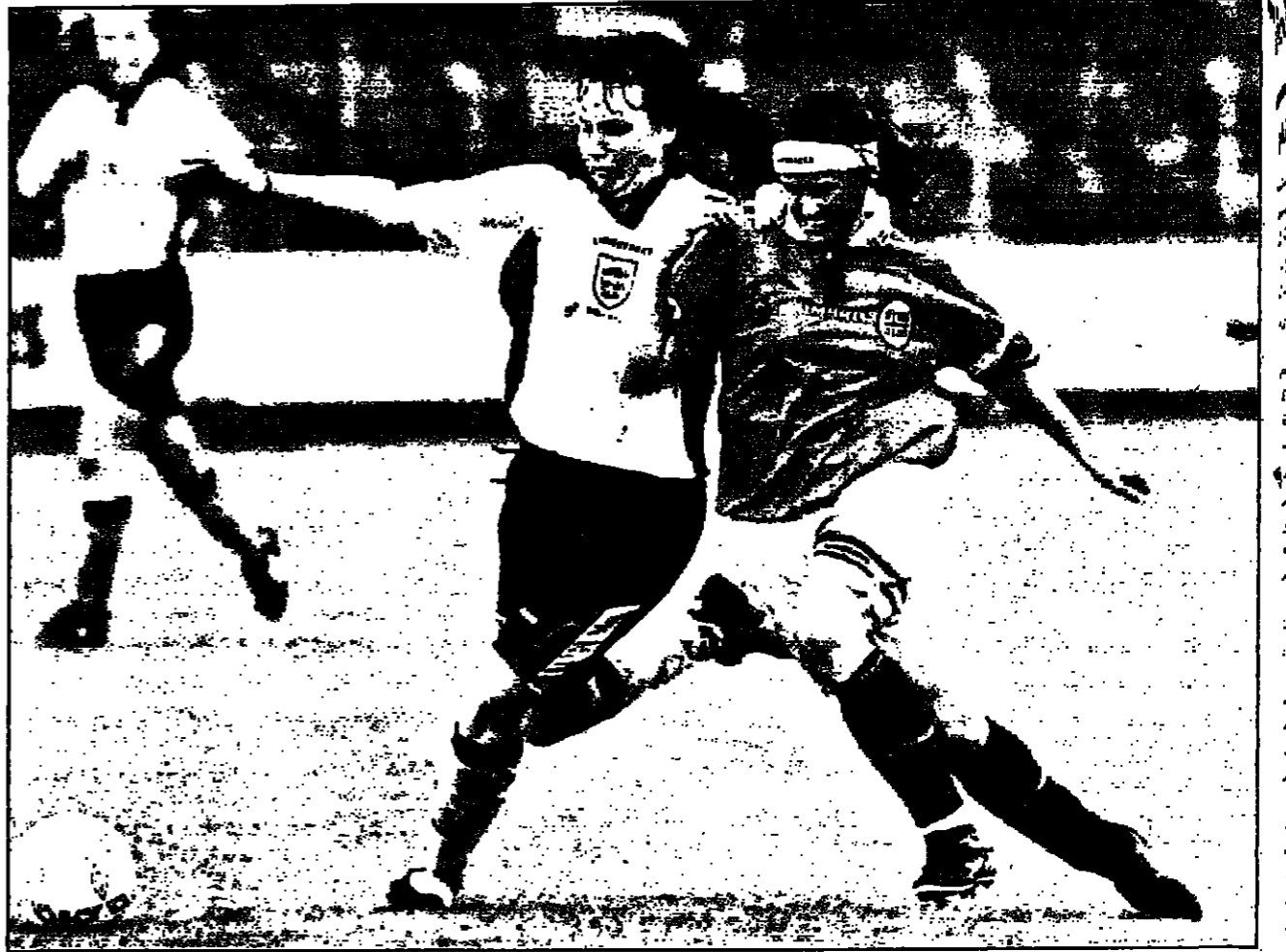
لقطة من إحدى مباريات التأهل لبطولة العالم لكرة القدم النسائية تظهر فيها التونسية مارغون موزيت (يمين) تصارع موزين مارلي في المباراة التي فلات فيها للتونج 2/0